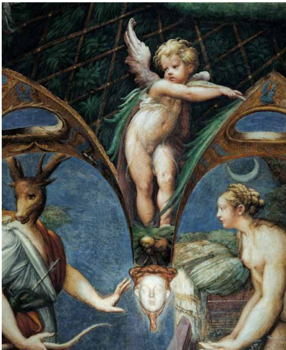
Particolare del mito di Diana e Atteone dipinto dal Parmigianino, appena ventenne, nella Rocca Sanvitale di Fontanellato.

Info turistiche: Piazza Matteotti, 1 Fontanellato (PR) tel. 0521.823221 info@castellidelducato.it www.castellidelducato.it